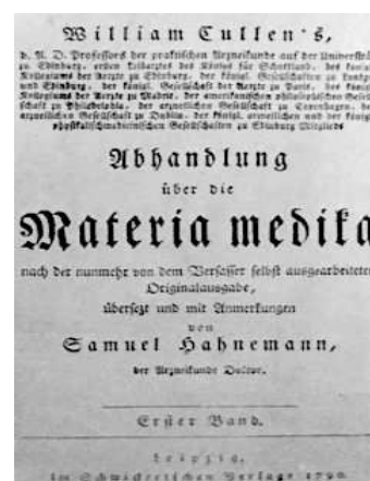
Matière Médicale de W.Cullen

La certitude en médecine représentait pour Hahnemann dans cette publication « le fruit de la réflexion, de la critique et de l'expérience. »