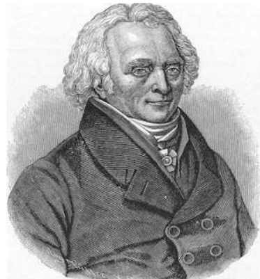
DR. C. WILHELM HUFELAND.

Alors qu'il pratiquait encore la médecine officielle, Samuel Hahnemann publia un article sur la certitude et la simplicité en médecine praticienne, dans l'esprit d'acquiescer une méthode plus simple et plus sûre de guérison. L'évolution d'Hahnemann par rapport à l'état médical et sanitaire de son époque, lui permettait d'être déjà optimiste.