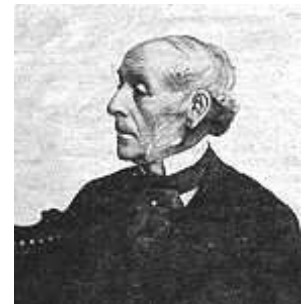
Ernest W. Legouvé

Homme de lettres renommé de son temps, Ernest Legouvé fit appel à Hahnemann quand sa petite fille fut laissée pour morte par les médecins de l'école officielle. Voici des extraits des souvenirs de Legouvé :