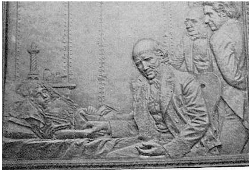
HAHNEMANN AS PHYSICIAN (from bas-relief, Washington Monument).

Ces trois sources d'étude de l'écoute médicale selon Samuel Hahnemann présentaient une cohérence et une continuité entre elles. Les qualités de cette écoute ont conservé une valeur utilisable pour la pratique médicale actuelle.