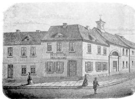
Maison de Hahnemann à Köthen

J'avais tendance à partager cet avis quand je commençais à lire les journaux de malades d'Hahnemann ; mais avec le recul, les prescriptions parisiennes d'Hahnemann m'ont semblé souvent bien documentées et cohérentes ; parfois seulement, la prescription médicamenteuse m'a semblé difficile ou impossible à comprendre à la suite de l'observation.