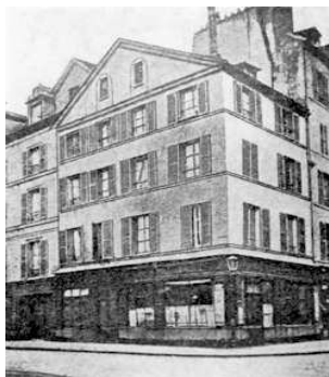
Domicile de Hahnemann 1 rue de Milan à Paris

Dès la reprise de son exercice médical à Paris (il ne comptait plus exercer en quittant Köthen pour s'installer à Paris avec Mélanie), Hahnemann se fit parvenir ses journaux de consultation allemands (2).