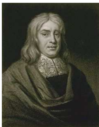
Dr Thomas Sydenham